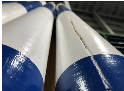
↑割れが発生している様子